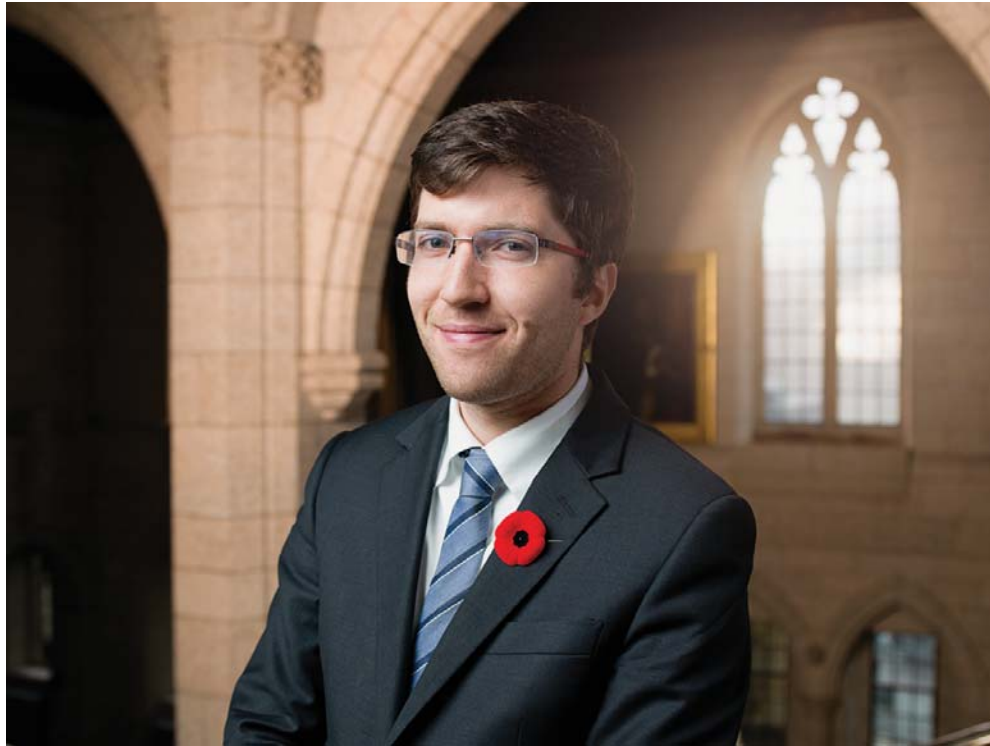
Parliamentarian of the Year / Parlementaire de l'année: Garnett Genuis

Chaque année, Maclean's demande aux 338 députés de proposer des candidats pour les prix « Parlementaire de l'année » dans chacune de huit catégories différentes. Voici les gagnants pour 2017.