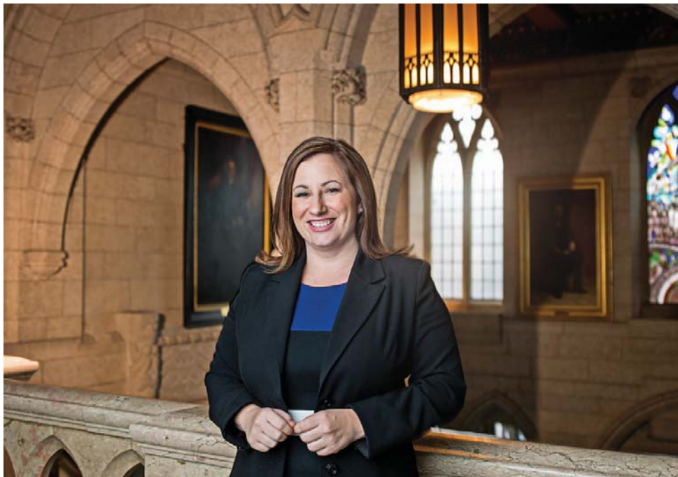
Best Represents Constituents / Meilleur travail dans sa circonscription: Shannon Stubbs

Former winners / Anciens gagnants: Tom Mulcair, Irwin Cotler, Peter Stoffer, Elizabeth May, Bob Rae, John Baird, Jason Kenney