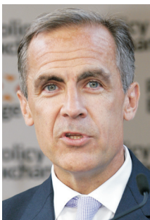
Prime Minister Mark Carney

As a crisp September dawned, NDP Leader Jagmeet Singh announced that his party would end the supply and confidence agreement inked with the Prime Minister back in 2022. No doubt the fire around the Liberals was burning too hot for the NDP, who decided they had won on enough of their priorities, including dental care and pharmacare, and were ready to re-take their opposition role in the House of Commons, positioning themselves to attack their erstwhile allies ahead of a likely election. The move left the governing Liberals open to a series of confidence motions, with the NDP supporting them on a case-by-case basis. A recipe for stable governance, this was not, and Canadians developed a sense that the government could fall at any moment. This coincided, perhaps unsurprisingly, with the lowest polling numbers and personal approval ratings for the Prime Minister since he entered politics.